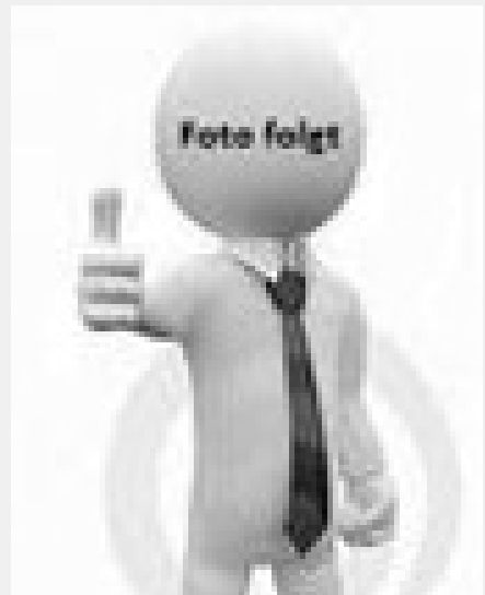
Ines Byczynski Steuerfachangestellte