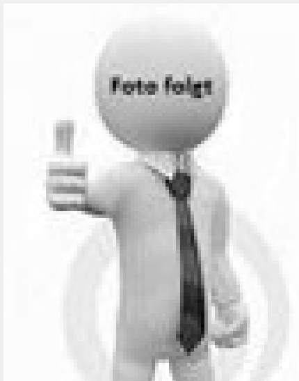
Ines Dabel Steuerfachangestellte