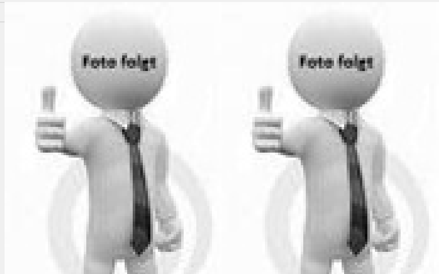
Gunda Hahn Steuerfachangestellte